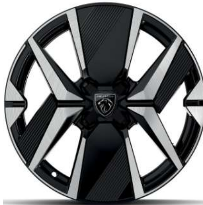
Jantes alliage 17" diamantées YANAKA bi-ton vernis brillant et Noir Orbital avec inserts Noir Orbital et vernis mat De série sur ENVY et GT