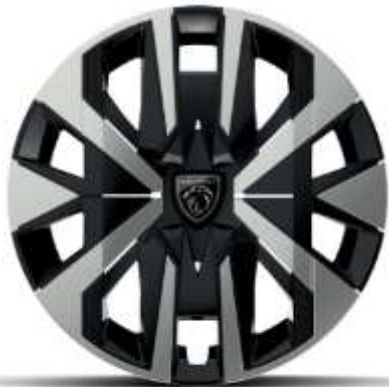
Jantes tôle 16" avec enjoliveurs MONTI Gris Eclat avec vernis brillant & noir grainé De série sur STYLE et BUSINESS