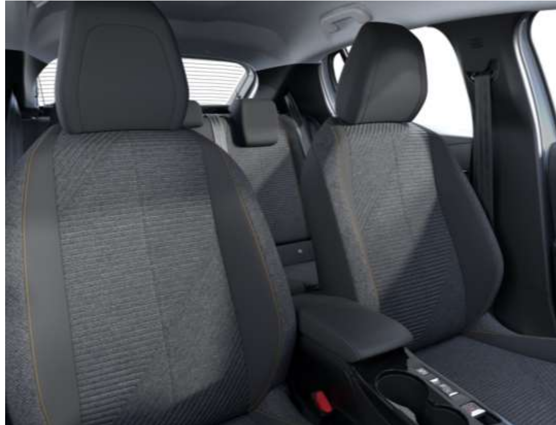
Sellerie tissu RENZO, accompagnement Rimini, surpiqûres Orange Sunrise