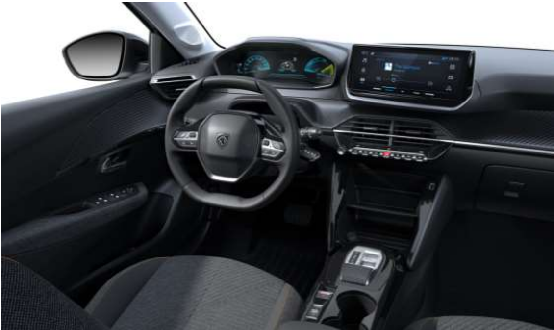
Planche de bord Slush avec décor Carbone slush