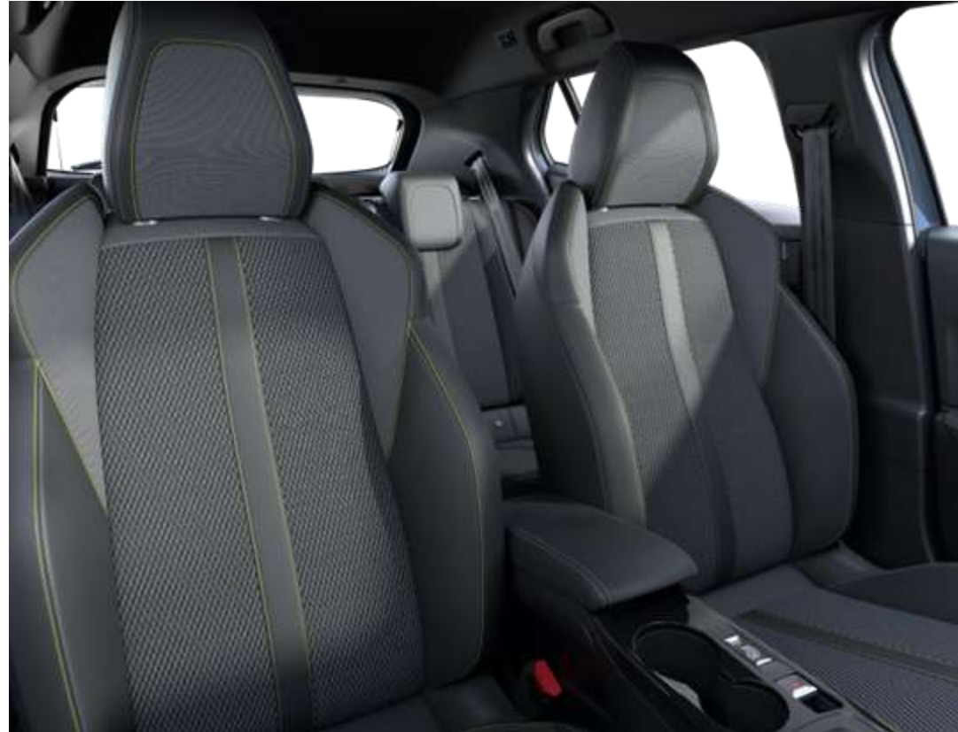
Sellerie tissu BELOMKA, accompagnement TEP Isabella, trimatière Uni Capy et surpiqûres Vert Adamite