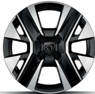
Jantes alliage 16" diamantées NOMA bi-ton vernis brillant et Noir Orbital De série sur ALLURE