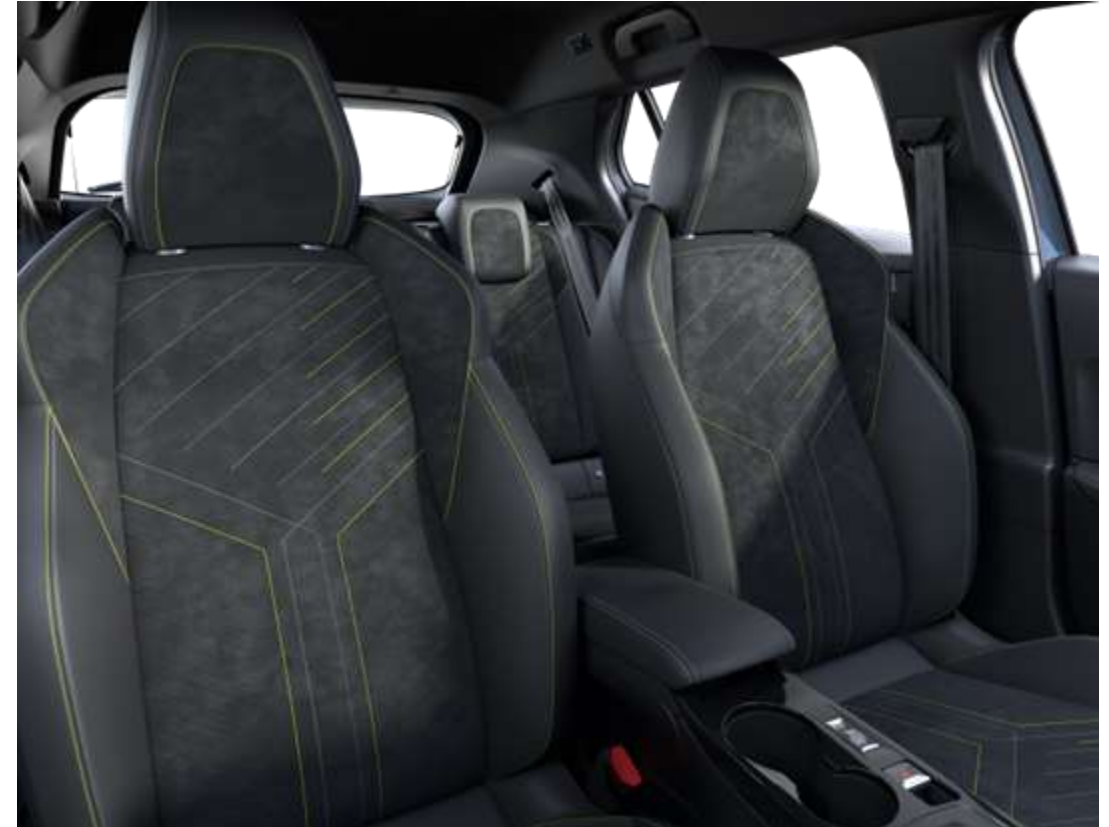
Sellerie Alcantara® Mistral ICONIUM accompagnement TEP Isabella, trimatière Alcantara Noir et surpiqûres Vert Adamite