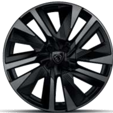
Jantes alliage 18" diamantées EVISSA bi-tons Noir Onyx, vernis Black Mist avec inserts Noir Onyx mat

De série sur ALLURE, GT En option sur BUSINESS (Sauf si Pneumatiques All Seasons))