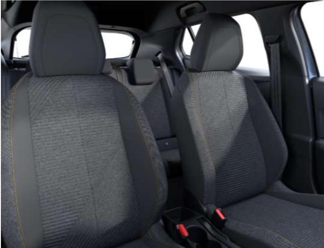
Sellerie tissu RENZO, accompagnement Rimini, surpiqûres Orange Sunrise G9FX De série sur STYLE et BUSINESS