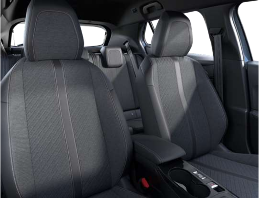
Sellerie tissu CASUAL LOMSA embossé, accompagnement TEP Isabella, tri-matière LOMSA et surpiqûres Quartz AQFX De série sur ALLURE et ENVY