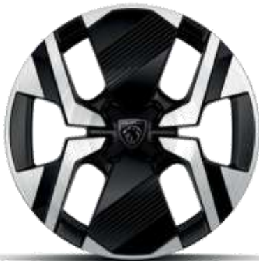
Jantes alliage 17" diamantées KARAKOY bi-tons Noir Onyx et vernis brillant

De série sur ALLURE, GT En option sur BUSINESS (Sauf si Pneumatiques All Seasons))