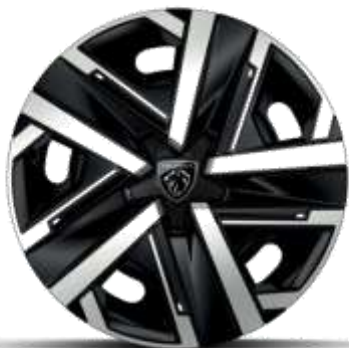
Jantes tôle 16" avec enjoliveurs SILOM Gris Eclat & Noir Orbitat, vernis mat